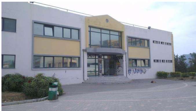
IT titkárság épülete