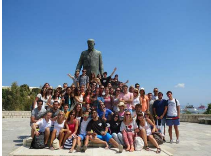
Az Erasmusos csapat

Én repülővel érkeztem Bécsből, Athénon keresztül mindössze egy feladott poggyásszal és egy jól megrakott kézi csomaggal. Alapvetően ezt a kiutazási lehetőséget javaslom, de lehet busszal is jönni Budapestről, viszont az két napig tart. Autóval kijönni nem nagyon érdemes, mert itt nagyon magasak a benzinárak (1,8 €/l).