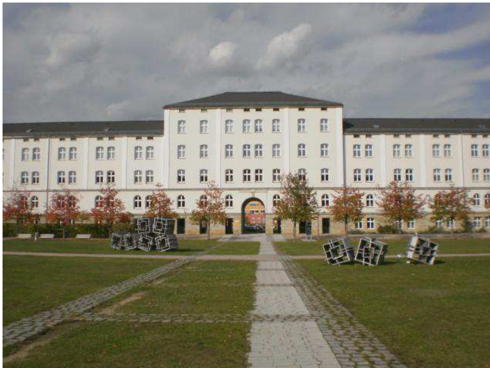
Villamosmérnök és Informatika épülete az iskola udvaráról