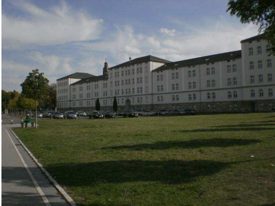
Villamosmérnök és Informatika épülete kintről