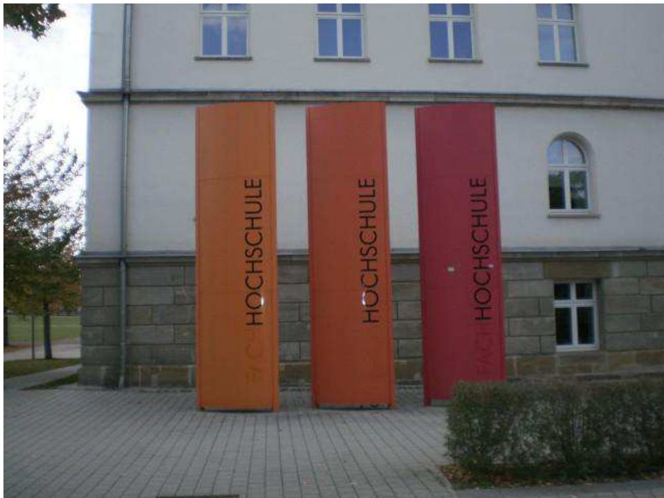
Villamosmérnök és Informatika épülete kintről