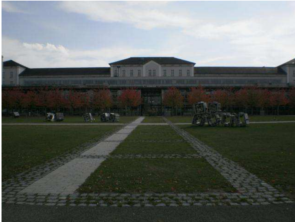
Gépészmérnöki és környezetvédelmi mérnök épülete az iskola udvaráról