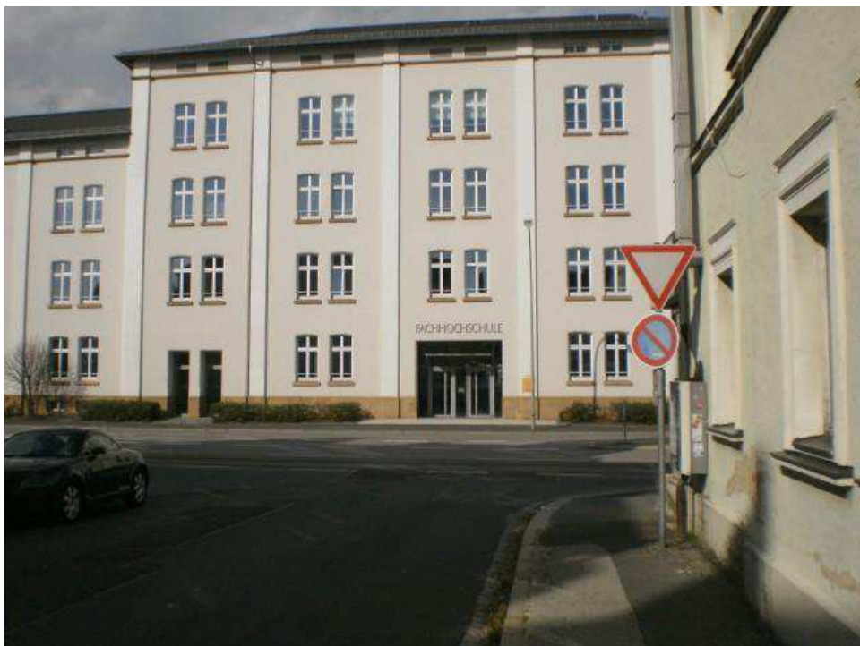
Gépészmérnöki és környezetvédelmi mérnök épülete az utcáról nézve